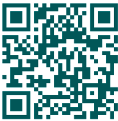
คู่มือการใช้งาน e-Request