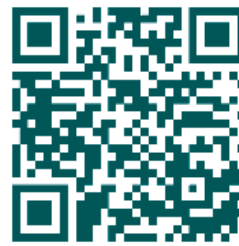
คู่มือการใช้งาน e-Voting

*หมายเหตุ การทำงานของระบบประชุมผ่านสื่ออิเล็กทรอนิกส์ และระบบ Inventech Connect ขึ้นอยู่กับระบบอินเทอร์เน็ตที่รองรับของผู้ถือหุ้นหรือผู้รับมอบฉันทะ รวมถึงอุปกรณ์ และ/หรือ โปรแกรมของอุปกรณ์ กรุณาใช้อุปกรณ์ และ/หรือโปรแกรมดังต่อไปนี้ในการใช้งานระบบ